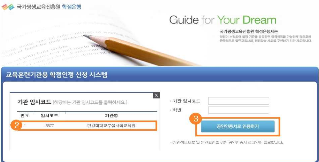
[그림 2. 학점인정신청 로그인]